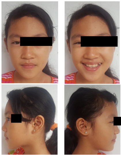
Gambar 6. Foto ekstraoral setelah perawatan