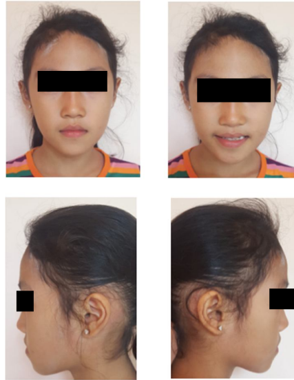
Gambar 1. Foto ekstraoral sebelum perawatan

Fakultas Kedokteran Gigi Universitas Andalas Jalan Perintis Kemerdekaan No. 77 Padang, Sumatera Barat Web: adj.fkg.unand.ac.id Email: adj@dent.unand.ac.id