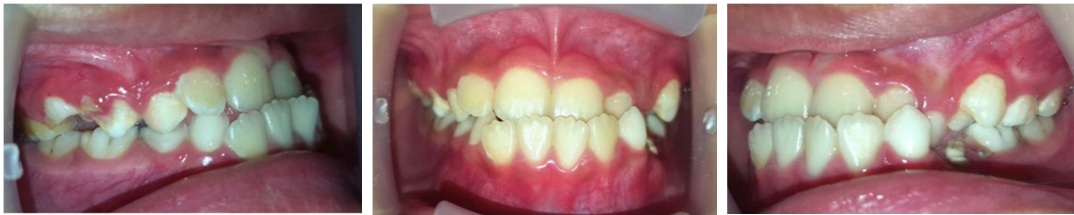
Gambar 2. Foto intraoral sebelum perawatan