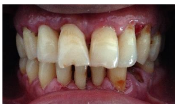
Gambar 1. Gambaran klinis pasien sebelum dilakukan splinting

bungkus rokok dalam sehari. Pemeriksaan ekstraoral menunjukkan tidak ditemukan adanya kelainan. Pemeriksaan intraoral ditemukan adanya kalkulus supragingiva dan subgingiva menyeluruh hampir pada semua gigi, namun paling banyak pada anterior rahang bawah dan rahang atas, OHI dan RKP kategori buruk. Terdapat oedem disertai warna merah mengkilap pada margin gingiva bagian vestibular gigi 15, 14, 13, 12, 11, 21, 22, 23, 24, 34, 33, 31, 41, 42 dan pada bagian lingual/palatal gingiva gigi 13, 12, 11, 21, 22, 23, 24, 33, 41, 42, dan 43. Konsistensi gingiva lunak, tanpa stippling dan permukaan licin. Resesi pada gigi 12, 11, 21, 32, 33, 41, 42, 43, 44, dan atrisi pada gigi 11, 21, 32, 41, dan 42 disertai mobility grade 1 pada gigi 33, mobility grade 2 pada gigi 32, 42, 43, 44, serta mobility grade 3 pada gigi 41.