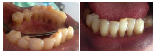
Gambar 4. Tampak lingual dan labial setelah aplikasi splinting

identifikasi dilakukan maka diputuskan untuk melakukan beberapa perbaikan guna mencegah terlepasnya splinting , diantaranya dengan memaksimalkan isolasi daerah kerja, serta mengkombinasikan splinting ekstra koronal pada gigi 33, 32, 41, 42, 43 dan intra koronal pada gigi 44 dan 45. Selain itu dilakukan penambahan flowable resin pada bagian interdental labial pada gigi tersebut serta dilakukan DHE kepada pasien untuk lebih berhati-hati dan menghindari penggunaan tusuk gigi atau alat lain yang dapat beresiko untuk terlepasnya splinting .