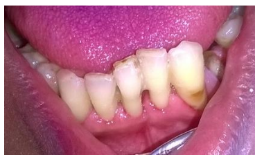
Gambar 5. Kontrol 1 bulan pasca splinting

masih tetap bertahan dengan baik, terdapat mobilitas gigi derajat 1 pada gigi yang di splinting dan gingiva sudah tidak berwarna kemerahan lagi. Hasil pemeriksaan pada kunjungan ini menunjukkan terdapat pengurangan mobilitas gigi dari derajat 2 dan 3 menjadi derajat 1, serta hilangnya tanda inflamasi berupa warna kemerahan pada gingiva.