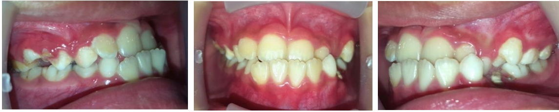
Gambar 2. Foto intraoral sebelum perawatan