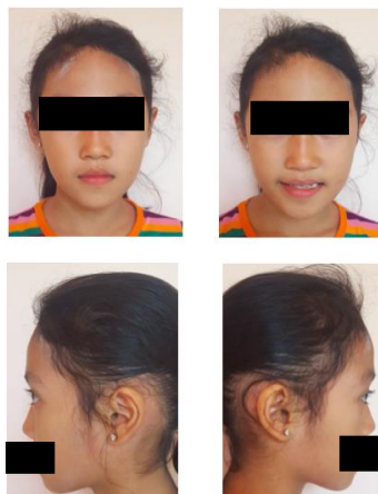
Gambar 1. Foto ekstraoral sebelum perawatan

Evaluasi maturasi vertebra servikal dengan menggunakan tahap perkembangan oleh Hassel dan Farman menunjukkan bahwa pasien berada dalam tahap transisi dengan sisa pertumbuhan pubertas sebesar 25% sampai 65 persen. Tujuan perawatan pada kasus ini adalah mengoreksi maloklusi Kelas III skeletal, crossbite anterior, mendapatkan lingkungan yang normal untuk pertumbuhan maksila, memperbaiki profil wajah dan mencapai oklusi yang sesuai dengan overjet dan overbite yang normal.