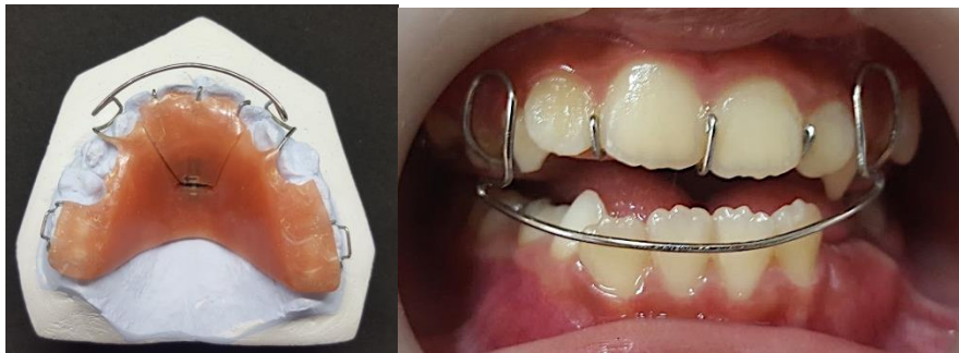
Gambar 4. Inverted labial bow dengan sekrup ekspansi pada maksila

Perawatan dimulai dengan peranti maksila removable yang memiliki tiga karakteristik khusus, (1) labial bow anterior yang dibuat dengan stainless steel wire 0,9 mm yang diadaptasi pada permukaan labial gigi insisivus mandibula, (2) klamer retensi yaitu Adams clasps dan interdental clasp , dan (3) peninggi gigitan posterior resin akrilik ketebalan 2 sampai 3 mm sehingga memungkinkan pergerakan gigi insisivus maksila ke labial, slow expansion screw ditempatkan pada sisi palatal gigi anterior maksila (Gambar 4).