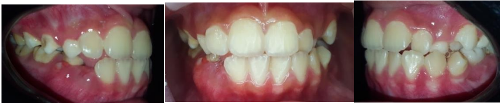
Gambar 5. Foto intraoral setelah perawatan

Laporan kasus ini menggunakan peranti ortopedi removable pada lengkung maksila dengan inverted labial bow dan slow expansion screw . Peranti ini telah digunakan dalam berbagai literatur dengan hasil klinis yang baik. Nama lain dari peranti ini adalah prognetic modified appliance , removable mandibular retractor dan Eschler arch . 6 Peranti inverted labial bow yang dikombinasikan dengan sekrup ekspansi ini digunakan sebagai alternatif untuk mengoreksi crossbite anterior pada perawatan awal pasien Kelas III skeletal yang masih berada dalam periode pertumbuhan. Efek perawatan dengan menggunakan peranti ini adalah kombinasi perubahan tulang dan gigi. Inclinasi insisivus atas cenderung meningkat sementara inclinasi insisivus bawah menurun, sehingga membantu dalam koreksi crossbite anterior.